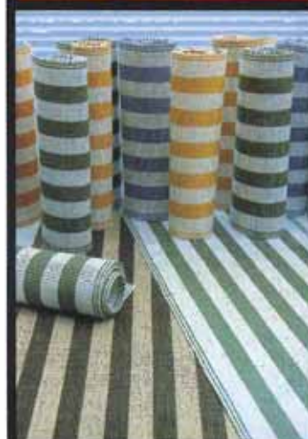
Opiskelijoiden suunnittelema ja toteuttama pellavainen kallallinsarja.