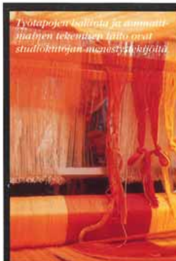
Työtapojen hallinta ja ammattilaisten tekemä taito ovat studiokutojan menestystekijöitä.

Studiokudonnan artonimitutkinto kehitettiin Heinolan käsi- ja taideteollisuusoppilaitoksessa 1990-luvun alussa. Opetusministeriö vahvisti 1994 tekstiilialan ammattitutkintojen tutkin-