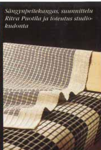
Sängynpeitekangas, suunnittelu Ritva Puotila ja toteutus studiokudonta.