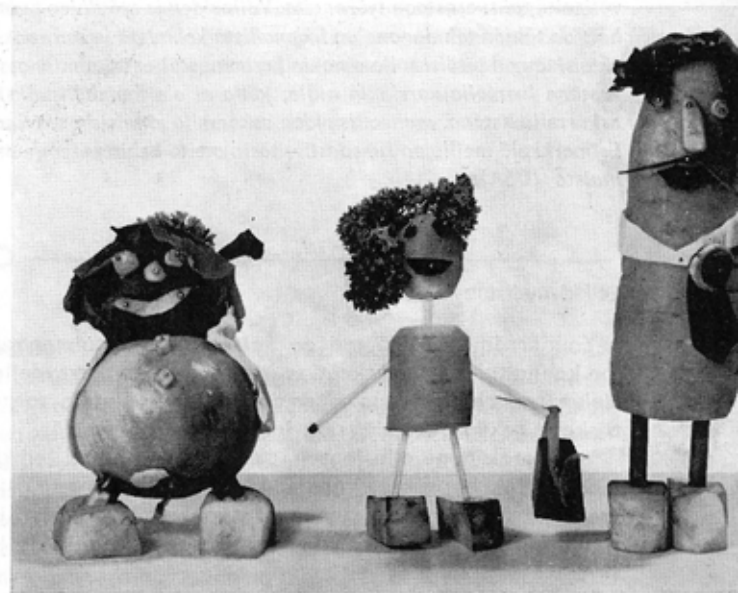
Mitä on taide? Eikö sekin pohjimmaltaan ole leikkiä. Tätä käsitystä tukee mm se, että taiteen määritelmästä ei ole päästy yksimielisyyteen. Määritelmäksi on lainattu tavallisesti joitakin irtonaisia lausuntoja milloin kenenkin tunnetun taiteilijan sanomana — viimeksi Picasson. Kun häneltä tätä samaa asiaa tiedusteltiin, hän vastasi: »En tiedä — ja jos tietäisin en sitä sanoisi.» Nykyaikaa vai askartelua?