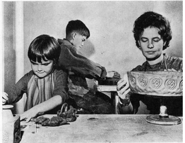
Askartelu, työn ja leikin välimuotona, tarjoaa tilaisuuksia itsensä ilmentämiseen käden työn kautta. Aidoimmillaan tämä toiminta on silloin kun sitä toteutetaan perheen piirissä.

Työn merkitystä emme kuitenkaan voi missään vaiheessa väheksyä. On aivan luonnollista, että työ muodostaa elämässämme yhä keskeisen tekijän. Sen avulla voimme saavuttaa niitä hyvyksiä, joihin mm vapaa-aika kuuluu. Mutta työllä on myös toinen merkitys, joka tässä yhteydessä muodostuu keskeiseksi: Työ tarjoaa ihmiselle tilaisuuden purkaa aggressioitaan, vihamielisiä voimiaan, ja muuttaa ne palvelemaan rakentavia tarkoituksia.