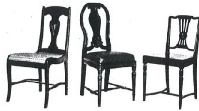
»Harjoittelma», »M. V.» ja »Selkänoja» (vasemmalta oikealle).

Ellen Key ei tietenkään tahdo asettaa esteitä virastoihin, konttori- ja pankkialoillekaan kutsumusta omaaville naisille, mutta toivoo, että ne naiset, jotka ovat muuten taloudellisesti tur-