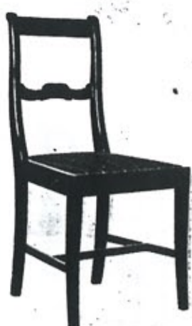
Vilho E. Aaltosen tuoli; nim. »Oppipoika». Saanut kunniamaininnan.

Ei voida kieltää, että naiset helpempaa työvoimaa tarjoamalla usein ovat saattaneet vaikeuttaa suurempaa perhettä huoltavan miehen toimeentuloa. Luonto on kuitenkin estänyt tälläkin alalla niin pahoja ruuhkia patoutumasta kuin ankarimmat naistyön vapauttamisen vastustajat olivat ennustaneet tapahtuvan. Tästä on meidän kiittäminen semminkin niitä