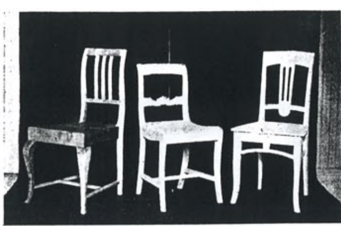
»Tuoli X», »Puusuutari 2» ja »Tulos 10» (vasemmalta oikealle lukien).

vaan on elinkeinotyö etsittävä maailmalta. Mutta tällöinkin Ellen Keyn mielestä nainen menettelee kaukonäköisimmin, jos hän etsii toimintaa niillä työaloilta, joilla hän tuntee liikkuvansa kodin piirissä saaduina äiteysvaistoin. Missä kaivataan hoivaajaa, kasvattajaa, auttajaa ja lohduttajaa, sinne lähinnä on naisen suuntauduttava.