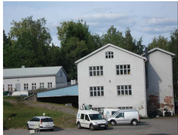
Yllä:Entisen juomatehtaan rakennuksia