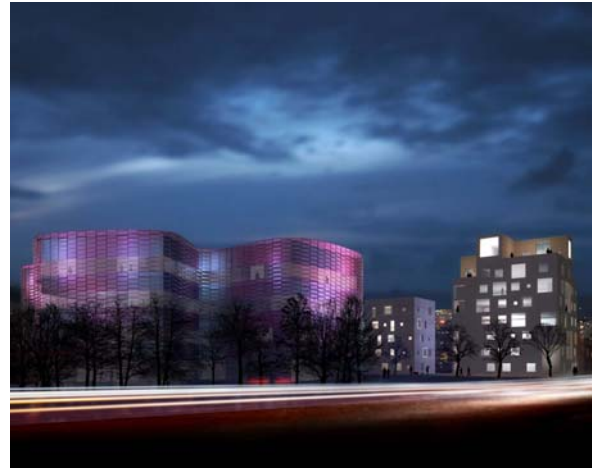
Yllä: Sisääntulo Jyväskylään – näkymäkuva VERSTAS Arkkitehdit Oy:n voittoisasta kilpailuehdotuksesta.