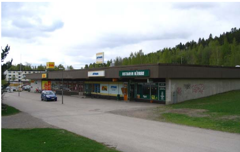
Kortepohjan ostoskeskus edustaa suorakaidemallia.

Jyväskylässä ostoskeskukset, kuten pienemmätkin asuinalueiden liikerakennukset ovat etupäässä suorakaidemallisia (esim. Lohikosken ostoskeskus, Kortepohjan ostoskeskus ja Keltinmäen ostoskeskus). Jyväskylän suorakaidemallisissa ostoskeskuksissa ja liikerakennuksissa liikehuoneistojen sisäänkäynnit ovat joko yhdeltä, tai useammalta sivulta rakennuksen takasivun ollessa huoltosivu. Pääjulkisivu tai –sivut ovat tyypillisesti jäsennelty nauhaikkunamaisesti sijoitetuin näyteikkunoin ja niiden väleissä olevin lasiovin. Lasi-teräs julkisivut luovat keveyden vaikutelman. Umpinaiset seinät jyväskyläläisissä liikerakennuksissa ovat useimmiten kalkkihiekkatiiltä. Näissä suorakaidemallisissa ostoskeskuksissa Jyväskylässä 1960-luvun piirteitä lasijulkisivujen ohella ovat raskaannäköiset kattoratkaisut: tasakattoisten rakennusten räystäät jatkuu lippamaisena katoksena julkisivujen ylle. Räystäään otsa on tyypillisesti leveä. Jyväskylän suorakaidemallisten ostoskeskusten ympä-