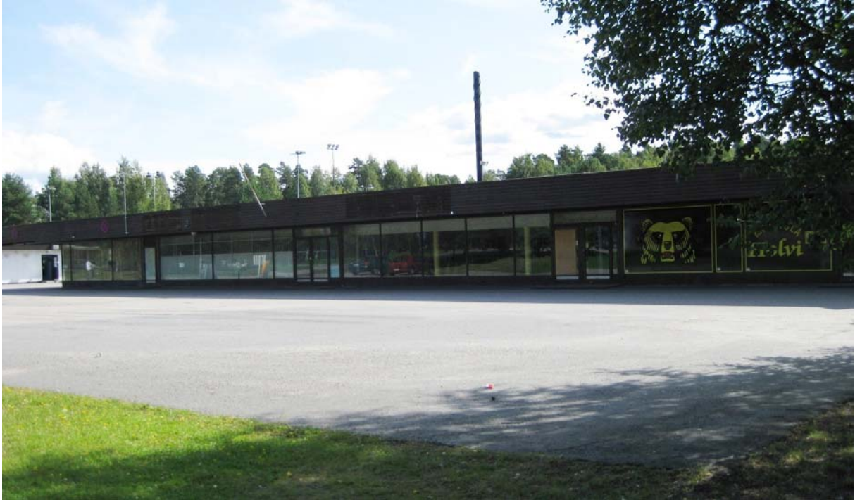
Jyväskylän Lohikosken ostoskeskus on rakennettu vuonna 1966. 1960-luvun ostoskeskukset ovat tyypillisesti yksikerroksisia tasakattoisia rakennuksia, joiden massoittelu korostaa mataluutta ja vaakasuuntaisuutta. Julkisivua jäsentää nauhaikkunat ja niiden väliset lasiovet. Kattorakenne on korostetun raskas.