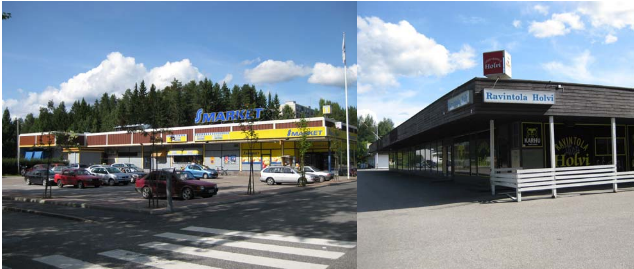
Jyväskylän ostoskeskukset ovat pääasiassa suorakaidemallisia. Vasemmalla Keltinmäen muutoksia kokenut ostoskeskus ja oikealla Lohikosken nyt tyhjillään oleva ostoskeskus.

ristöissä viihtyvyystekijöihin ei juuri ole kiinnitetty huomiota. Pihat ovat tyypillisesti asvaltilla päällystettyjä paikoitusalueita, jossa ei ole istutuksia, penkkejä tai muita oleskeluun houkuttelevia yksityiskohtia tai kalusteita. Kevytliikenne on erotettu autoliikenteestä ainoastaan Kortepohjan ostoskeskuksessa.