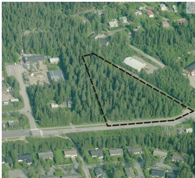
Viistoilmakuva 8/2007 suunnittelualueesta