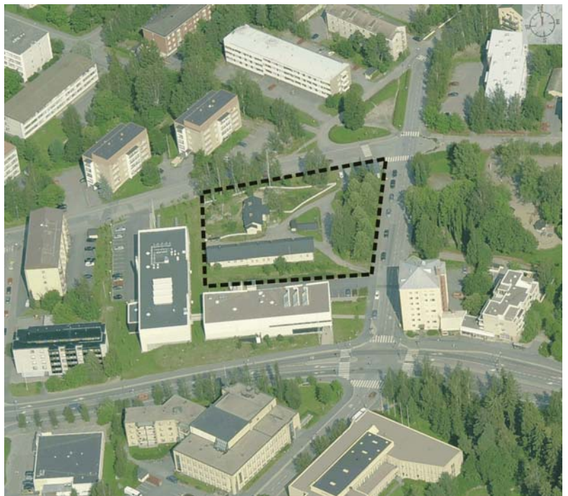
Suunnittelualueen rajaus, ilmakuva 8/2007